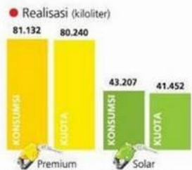
Ket. *Realisasi dan kuota rata-rata harian BBM bersubsidi

Berdasarkan data yang dimiliki Pertamina, kebutuhan rata-rata harian Premium dan solar selalu lebih besar dari kuota yang telah ditetapkan dalam APBN-P 2014. Tanpa pengendalian konsumsi seperti yang diinstruksikan pemerintah, Pertamina memperkirakan kuota solar bersubsidi bakal habis 6 Desember 2014, sementara Premium pada 27 Desember 2014