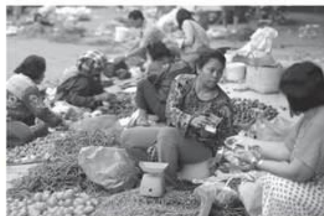
Kekhawatiran konsumen yang meningkat terhadap kondisi ekonomi ke depan menyebabkan kepercayaan konsumen menurun.

Menurut Purbaya, IKK turun tipis bisa dibalang fiat, kondisi ekonomi saat itu tidak membaik dan juga tidak memburuk sehingga ke depan konsumen akan sangat bergantung dengan kebijakan yang