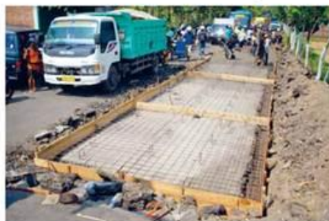
Defisit anggaran 2015 akan dialokasikan untuk kegiatan produktif. 0100-000-010

Pada pemerintahan mendatang, defisit hanya untuk mendorong sektor yang sangat strategis.