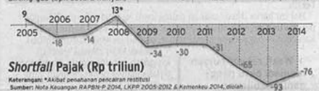
Shortfall Pajak (Rp triliun)

Keterangan: *Akibat penahanan pencairan restitusi