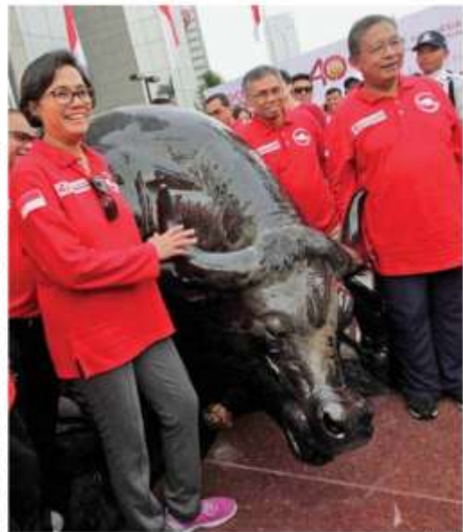
40 TAHUN PASAR MODAL INDONESIA: Menteri Perekonomian Daimi Nasution (kiri) bersama Menteri Sri Mulyani Indrawati (tari) berpose di antara barterng wulung di halaman Gedung BII, Jakarta, kemarin. Dalam memperingati 40 tahun pengaktifan kembali pasar modal Indonesia, BII mempromosikan ikon barterng wulung dari tali kayu yang berusia lebih dari 2,5 juta tahun asal Letek, Banten.

Direktur Utama BHI Suprajito menegaskan BHI akan akan memberikan edukasi kepada agen ritilik. Dengan jumlah yang sangat besar, agen ritilik bisa sangat sukses dalam memberikan edukasi ke masyarakat desa. Pada tahap kedua, Suprajito menekankan pemerintah akan memanfaatkan jaringan di pedesaan dalam melayani pendanaan rekening dana nasabah. (*/E-1)