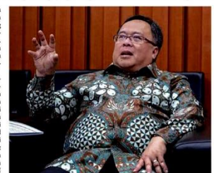
BAMBANG BRODJONEGORO, MENTERI PERENCANAAN PEMBANGUNAN NASIONAL/KEPALA BAPPENAS

Konferensi Tahunan SDGs Desember tahun lalu, Menteri PPN juga menebalkan pemerintah kedepannya akan terus mendorong SDGs Center di