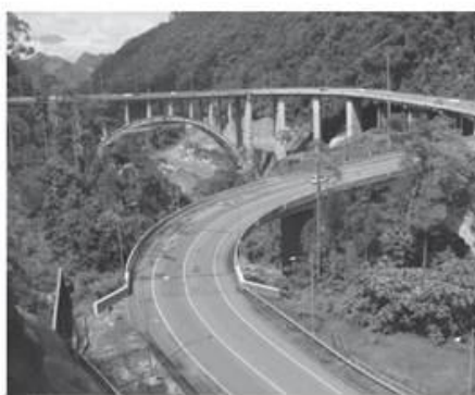
Pemerintah baru akan mendorong pembangunan infrastruktur.

2015 akan berusaha untuk memperbesar ruang fiskal lewat fraksi-fraksi di DPR. Namun jika hal ini tidak optimal, pemerintah baru akan mempercepat melakukan perubahan APBN 2015.