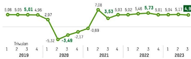
Sumber Pertumbuhan Ekonomi Indonesia Triwulan III-2023