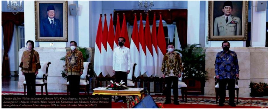
Presiden RI Joko Widodo ditempuh Menteri PPN/Kepala Bappenas Suharno Monorafi, Menteri Keuangan Sri Mulyani, Menteri Dalam Negeri Tito Karnavian, dan Sekretaris Kabinet Pramono Anung dalam Pembukaan Musrenbangnas 2021 di Istana Merdeka, Selasa (4/5/2021).